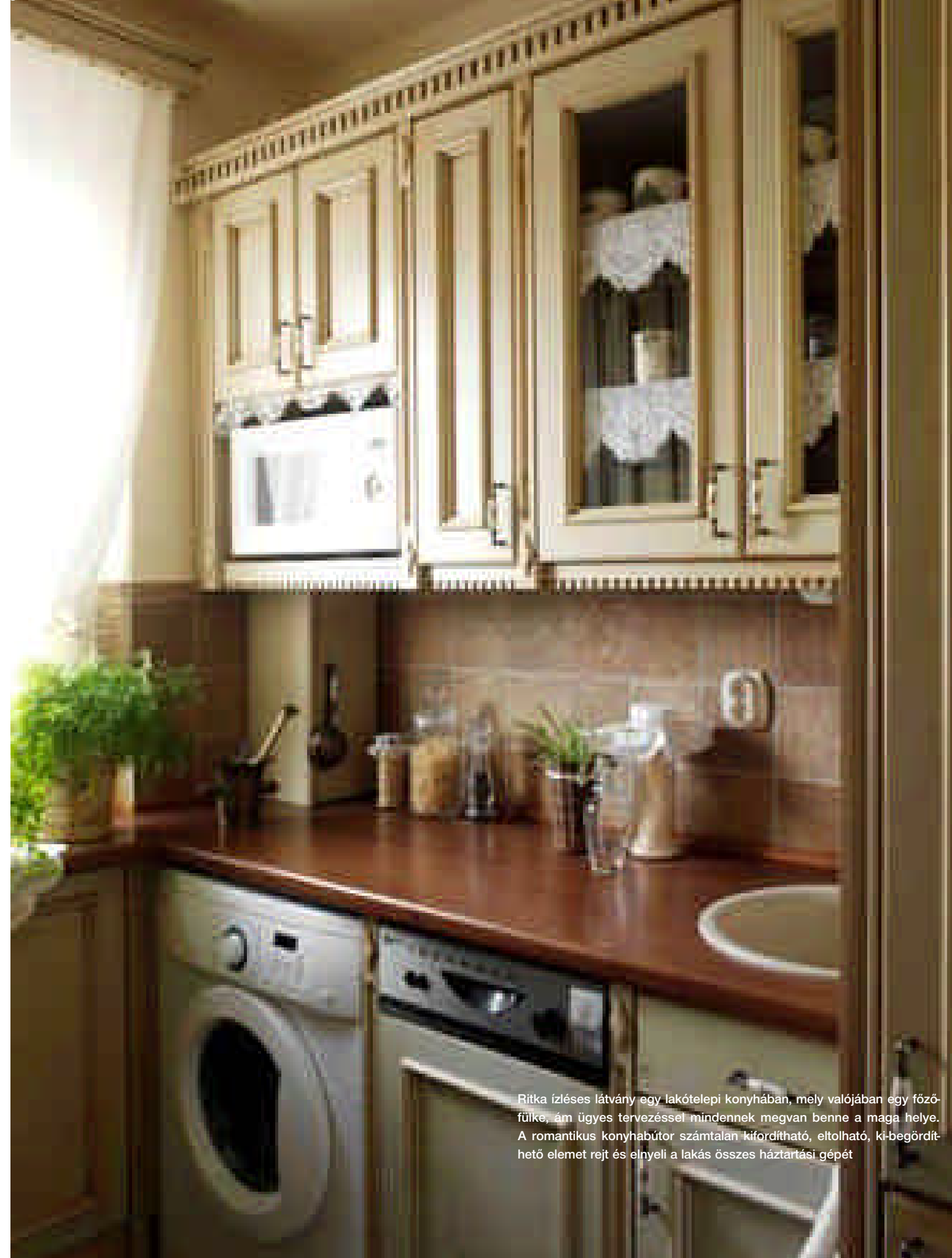
Ritka ízléses látvány egy lakótelepi konyhában, mely valójában egy főzőfülke, ám ügyes tervezéssel mindennek megvan benne a maga helye. A romantikus konyhabútor számtalan kifordítható, eltolható, ki-begördíthető elemet rejt és elnyeli a lakás összes háztartási gépét