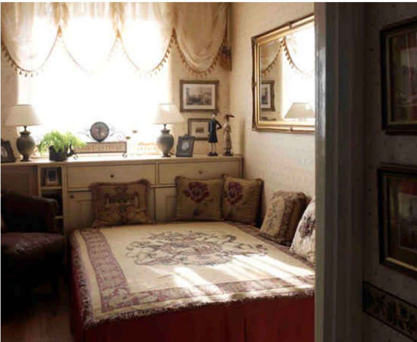
A csöppnyi hálószobában a nagyméretű ágy mellé még éppen befért egy marhabőr „nagyapafotel”, mely a lámpákkal, órákkal és szobrocskákkal a Nostalgia Shop-otól való. Az ablak alatti egyedi bútorbeépítés egyrészt ötletes tároló, másrészt a fűtőtestet takaró elem

utolsó függönyrojt is. A hangulatok itt „kitalálódnak”, majd megszületnek, mint a fürdőszoba tengerparton gyűjtött-szártott csillagai, a házilag készített szappanszákok, a réten szedett, majd megszártított virágok. A bútorokat itt előbb megálmodják, aztán rátalálnak, mint az ecseriről le vadászott, lomokkal teli, szűk ajtókon betuszkolt, szecessziós tálalószekrényt. A szép tárgyakat elképzelik, és rövidesen valamiből „létrejönnek”, mint a régiségekből összerakott, keretezett kollázsok, a többféle textilből varrott csipkeshoknyás párnák. Minden darab külön történetet hordoz, amin utólag jólesik nosztalgizálni, de anno megizzasztotta az alkotókat, mint a saját tervezésű konyhaszekrény, melynek ajtaját a megfelelő árnyalatért háromszor kellett átfesteni.