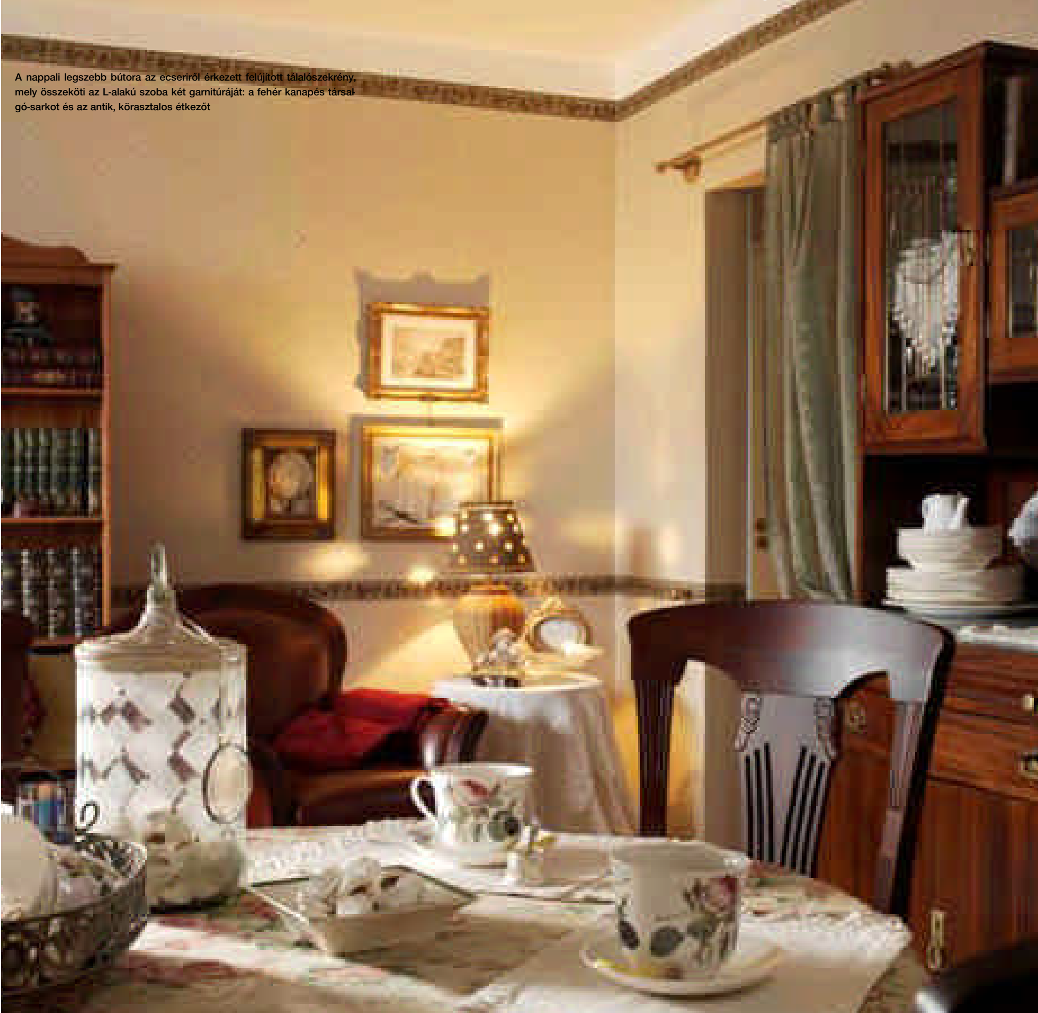
A nappali legszebb bútora az ecseriről érkezett felújított tálalószekrény, mely összeköti az L-alakú szoba két garnitúráját: a fehér kanapés társalgó-sarkot és az antik, kőasztalos étkezőt