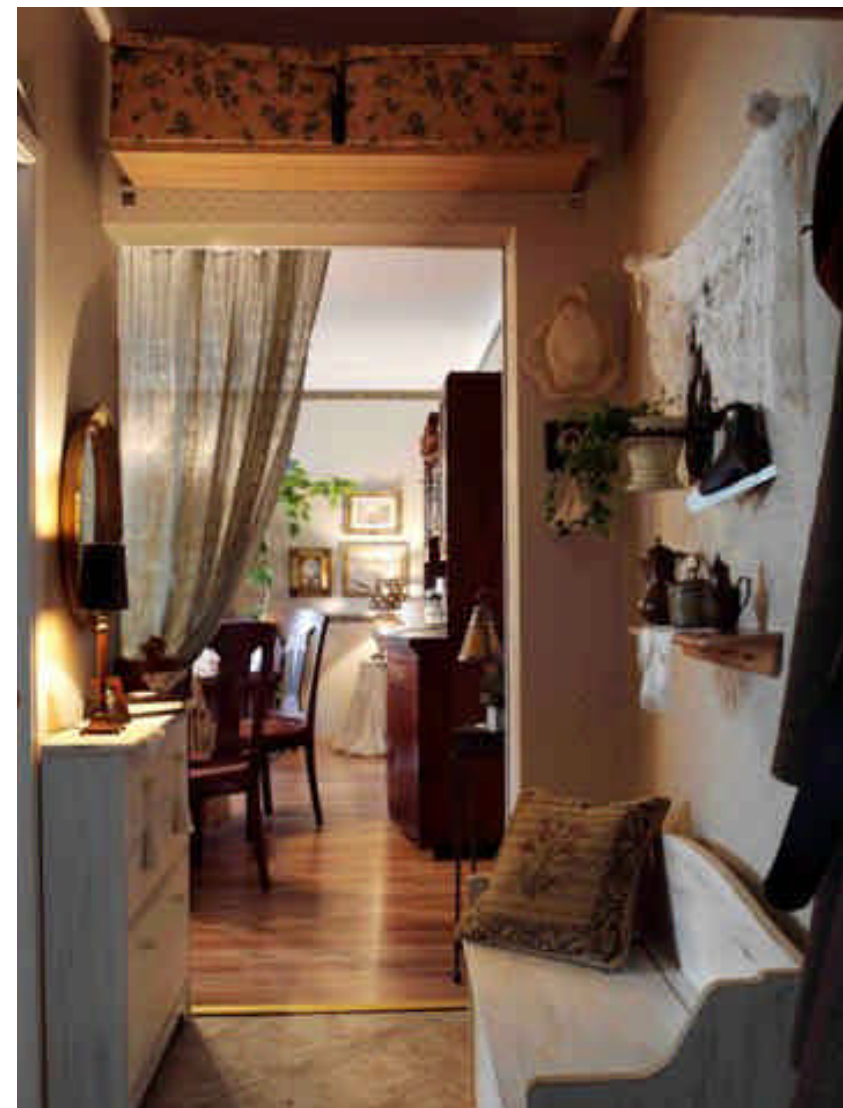
Már a parányi előszobában ízelítőt kapunk a lakás egységes stílusából. Színek, minták és formák együtt nosztalgáznak egy letűnt világ hangulatán

Fontos dolgok ezek az otthonról kapott, pici élménymorzsák, melyek jó esetben aztán a megfelelő irányba vezetik a felnőtt embert, mikor döntései előtt áll tudatlanul – pedig úgy hiszi, annyi mindent megtanult addigra már.